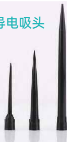
H款自动化导电吸头